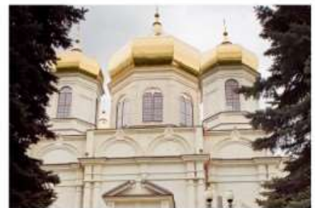
Казанский собор | Kazansky' Cathedral