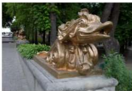
Проспект Карла Маркса | Karl Marks' avenue