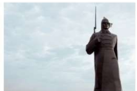
Мемориал «Солдат» | "Soldier" memorial