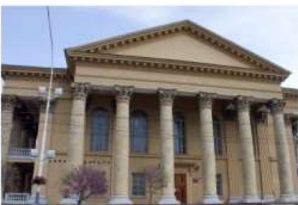
Кровая библиотека | Regional library