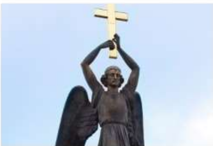
Ангел-хранитель | Angel-Guardian