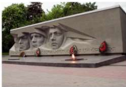
Вечный огонь | Eternal fire